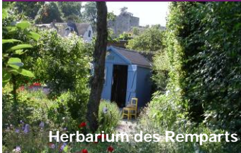
Herbarium des Remparts