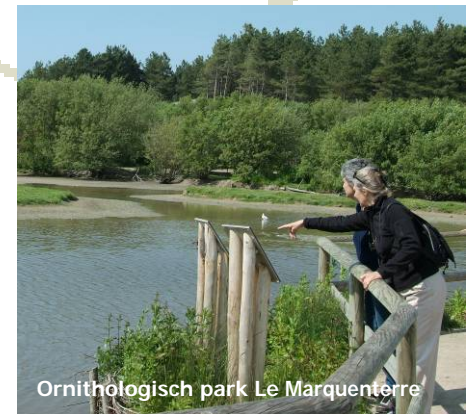
Ornithologisch park Le Marquenterre