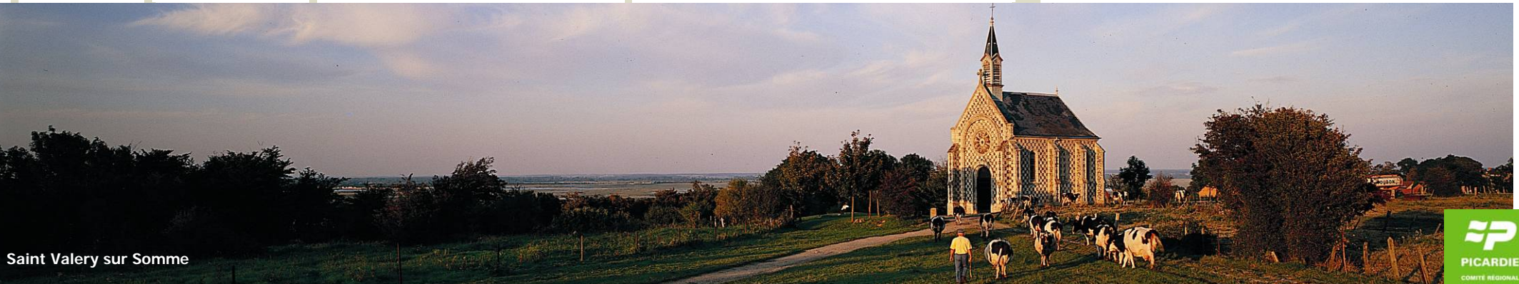
Saint Valery sur Somme