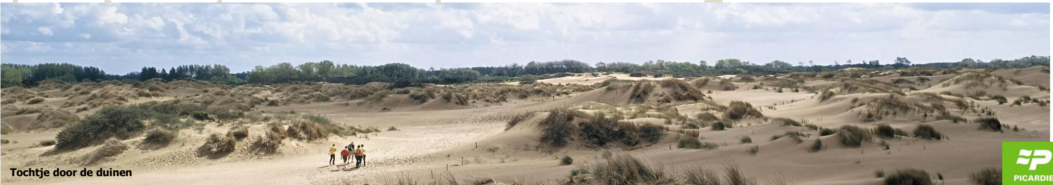
Tochtje door de duinen