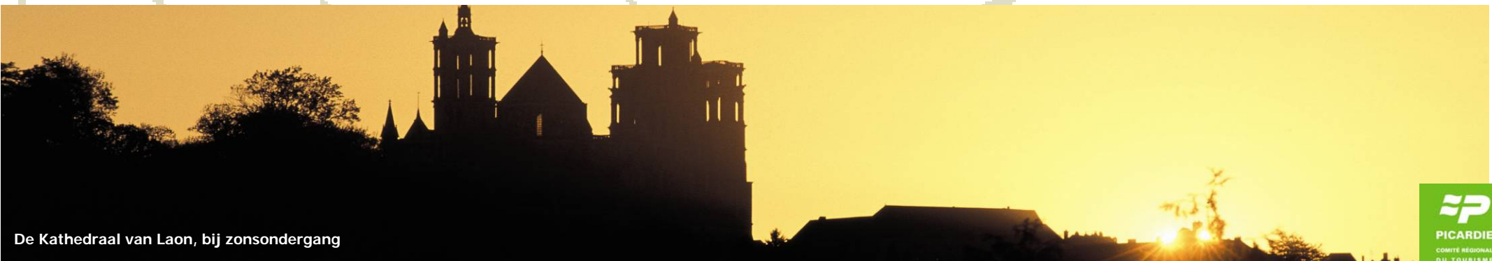
De Kathedraal van Laon, bij zonsondergang