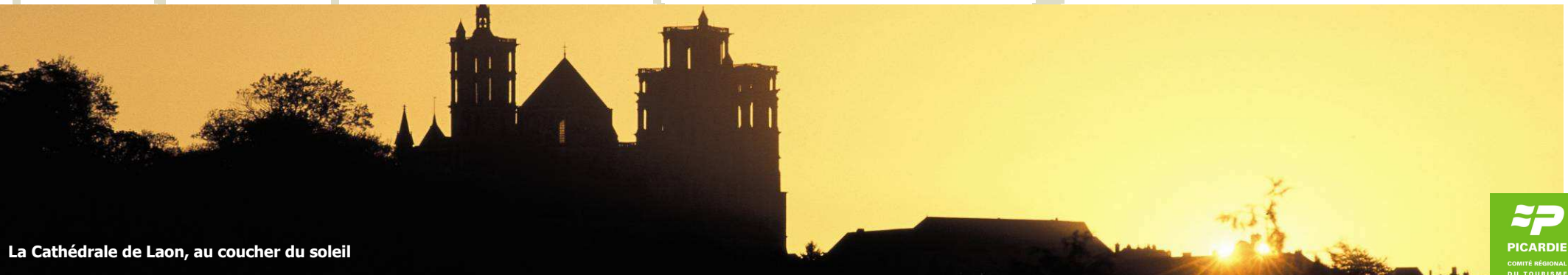
La Cathédrale de Laon, au coucher du soleil