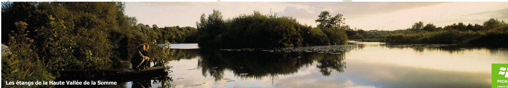
Les étangs de la Haute Vallée de la Somme