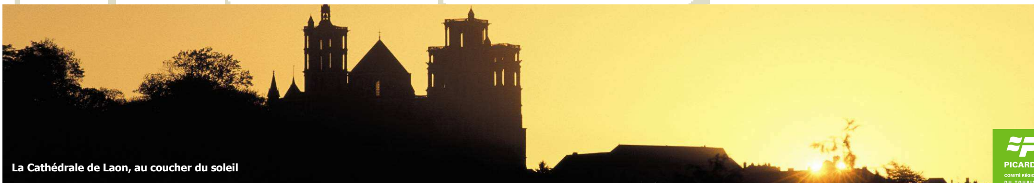
La Cathédrale de Laon, au coucher du soleil