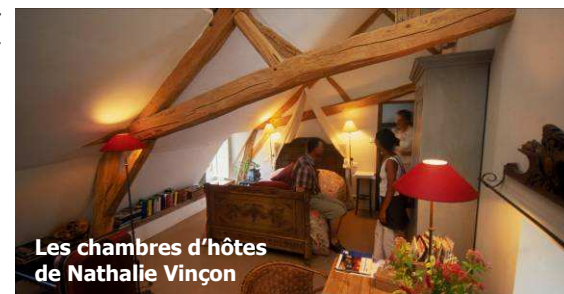
Les chambres d'hôtes de Nathalie Vinçon

Le Vendangeoir d'Orgeval 13, Grande Rue 02860 Orgeval (carte : L) Tél : 03 23 24 79 01 www.vendangeoir-orgeval.com