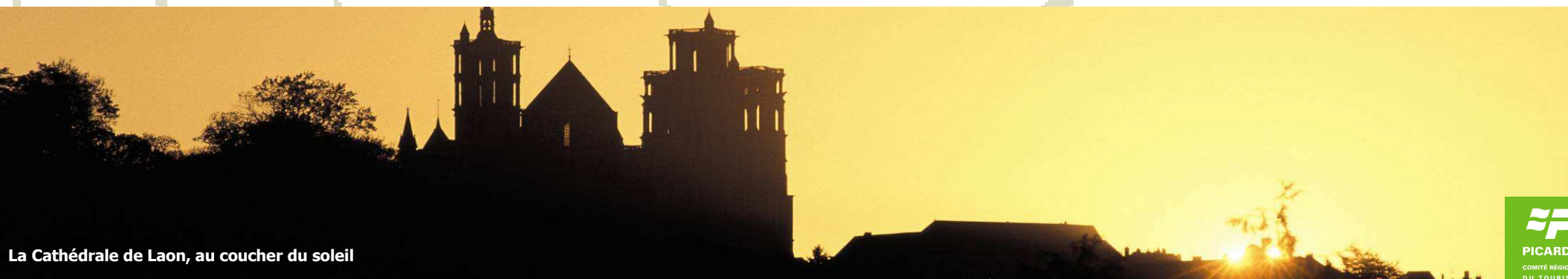
La Cathédrale de Laon, au coucher du soleil