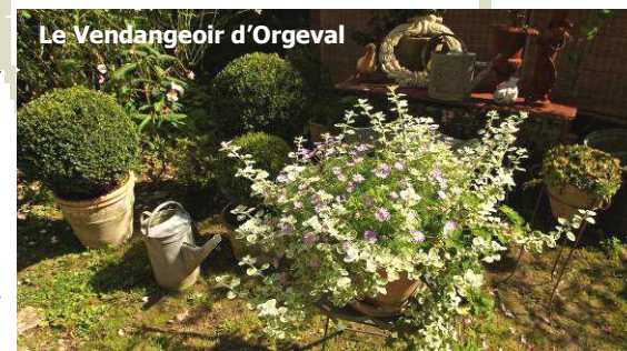
Le Vendangeoir d'Orgeval

« Ce qui frappe les visiteurs qui entrent chez moi, c'est la tranquillité. Mes visiteurs me disent souvent que lorsqu'ils s'assoient pour profiter du jardin, ils ont un peu l'impression d'être chez eux. Ça me fait plaisir, ça me montre que j'ai réussi mon pari : aménager mon petit coin de paradis et en faire profiter les autres. Derrière les murs qui entourent mon jardin, c'est la campagne à perte de vue. Les gens qui viennent me voir viennent aussi chercher des conseils, et moi j'adore en donner »