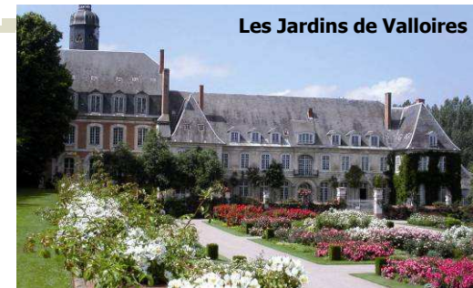
Les Jardins de Valloires

Les Jardins de Valloires 80120 Argoules (carte : H) Tél : 03 22 23 53 55 www.jardinsdevalloires.com