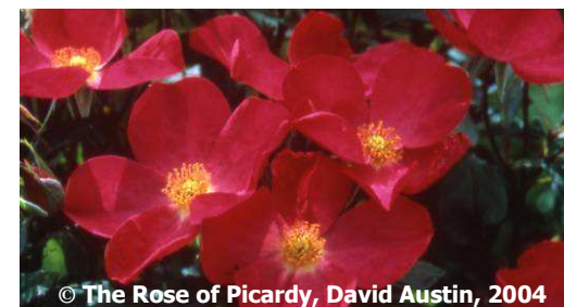
© The Rose of Picardy, David Austin, 2004